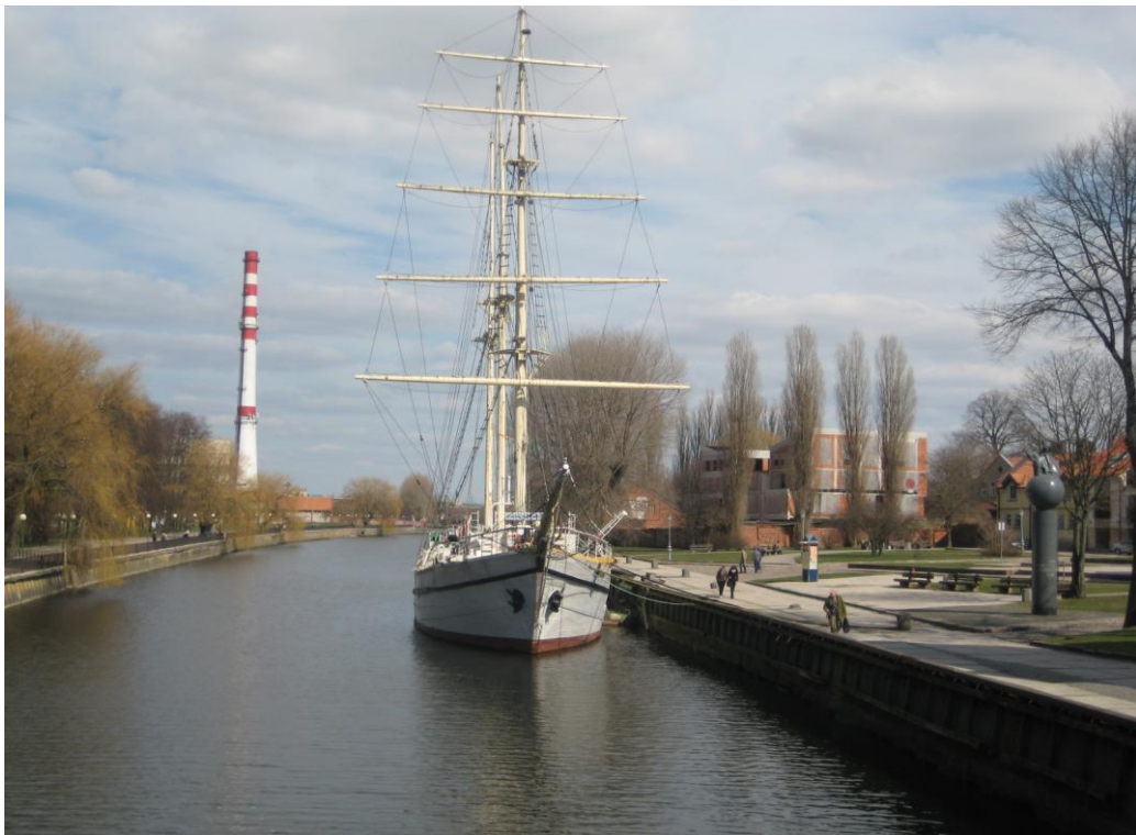
„Meridianas“, 2012 m. balandžio mėn.