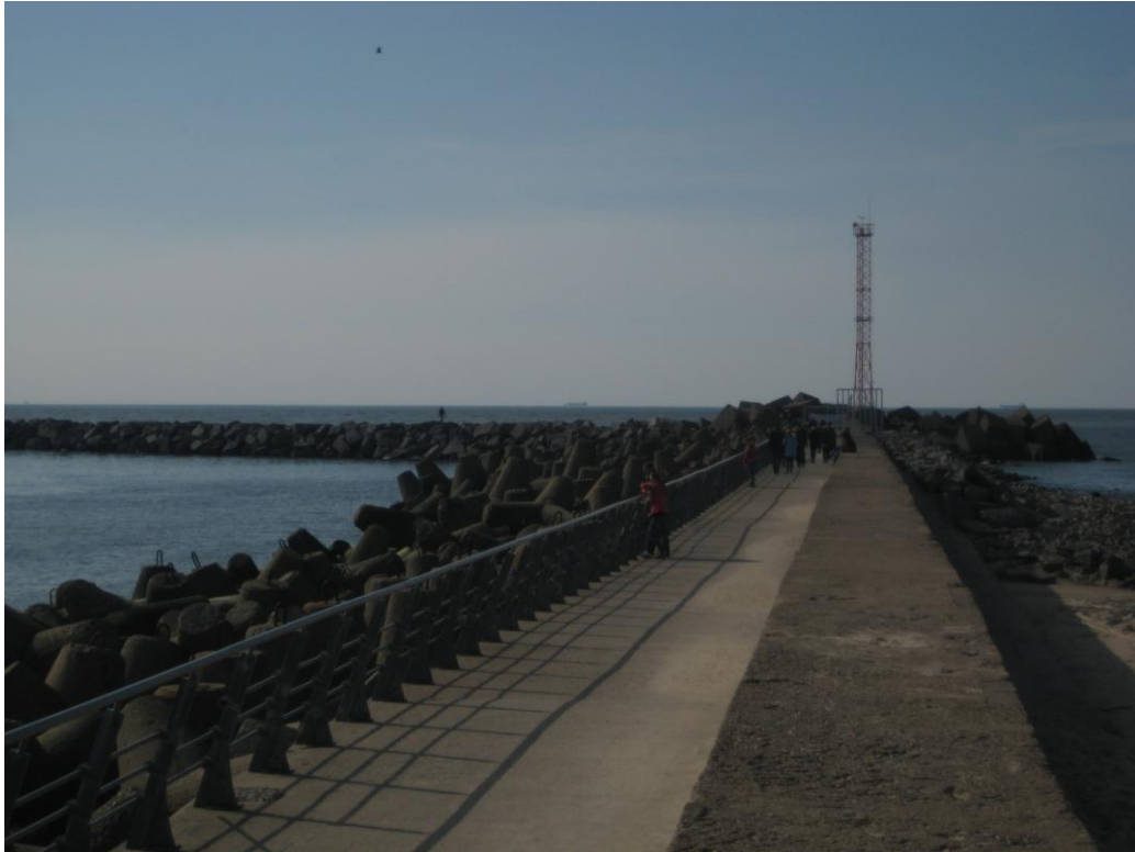
Molas, 2012 m. balandžio mėn.

Tai mano mylimo ir turbūt mylimiausio miesto vaizdai. Štai čia, šiame mieste aš gimiau ir augau, gyvenu ir gyvensiu. Todėl ir vadinu save klaipėdiete.