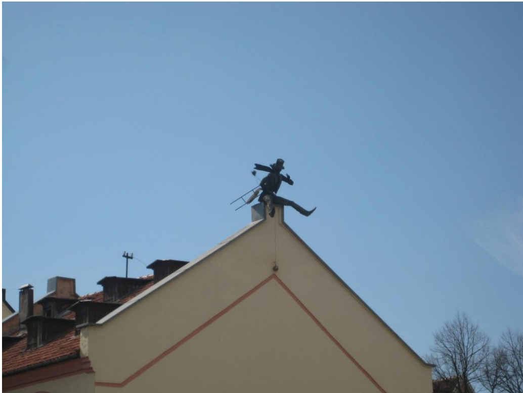
Skulptūra „Kaminkrėtys“, 2012 m. balandžio mėn.