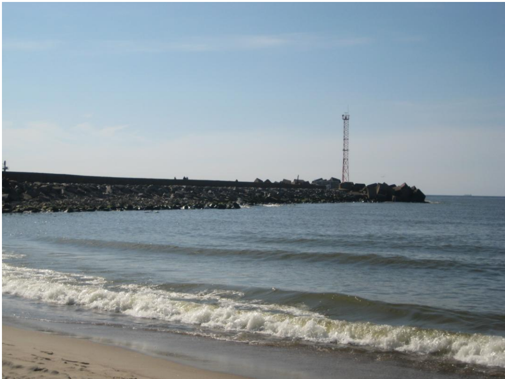
Baltijos jūra bei molas, 2012 m. balandžio mėn.