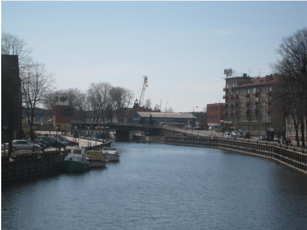
Danės upė, 2012 m. balandžio mėn.