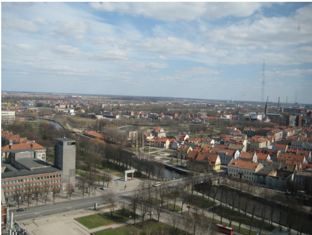
Klaipėdos senamiestis, 2012 m. balandžio mėn.